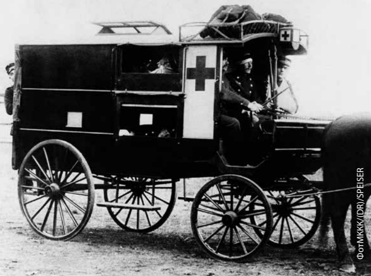
Машина скорой помощи датских вооруженных сил, 1878 г.