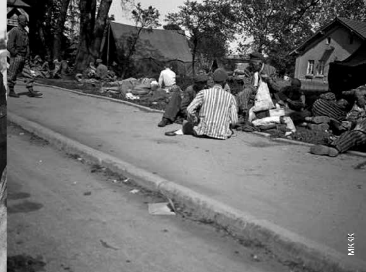
Вторая мировая война. 20 мая 1945 г. Германия. Советские заключенные концлагеря Дахау после освобождения