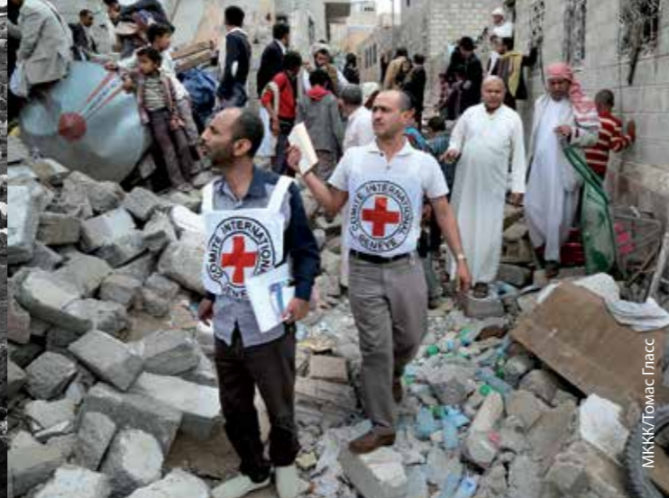
Йемен, Сана, 2015 г.