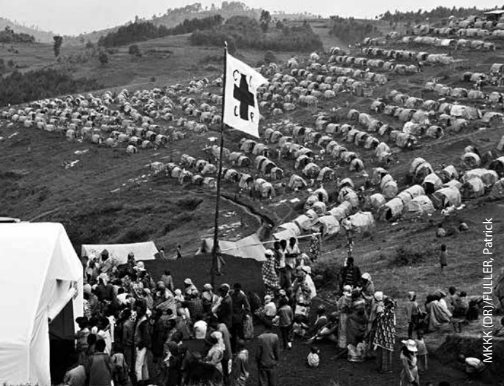
Руанда, 1994 г.