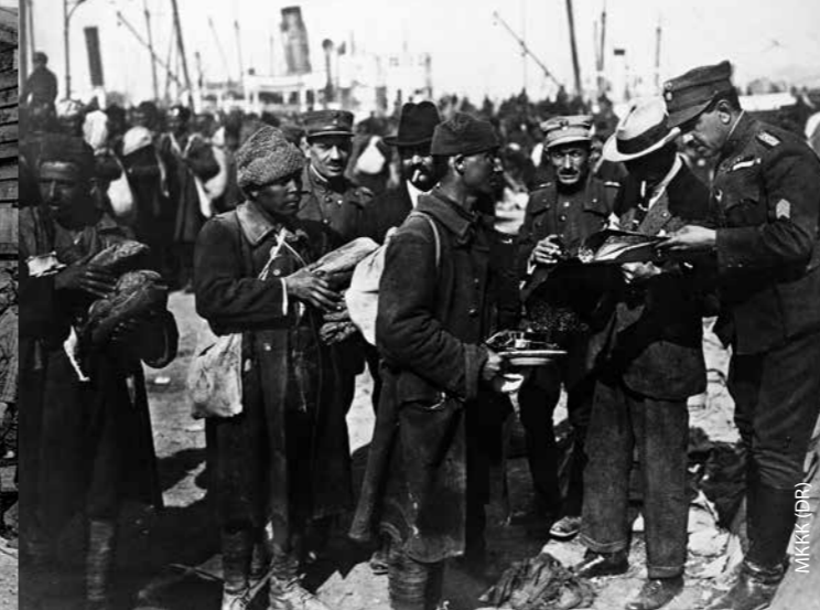
Греко-турецкая война 1919–1922 гг. Раздача продовольствия греческим беженцам из Малой Азии, организованная МККК